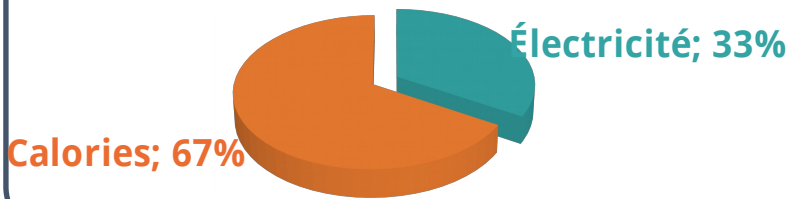
Comment est-ce consommé?