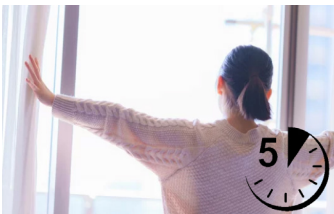
- ILLUSTRATIONS 1 -