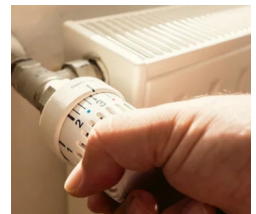
- ILLUSTRATIONS 2 -